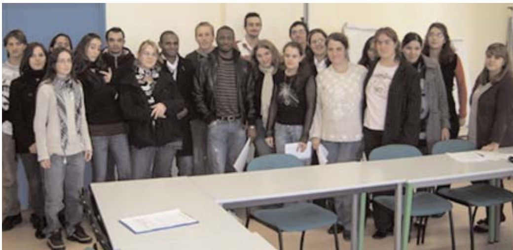
Au centre des stagiaires, Modibo Diarra

Chaque semaine les stagiaires fréquentent un club sportif qui a formé un champion du monde de boxe française : Modibo Diarra. Ils partagent avec lui le même entraîneur : Boris Ekomié. En pleine préparation de son combat contre Ibrahim Konaté prévu le 12 décembre 2009 (combat qu'il a d'ailleurs remporté), le champion châteleraudais est venu rendre une visite aux stagiaires.